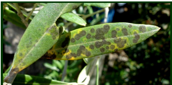
Manchas de olho-de-pavão nas folhas

O olho-de-pavão afeta a espécie cultivada ( Olea europaea e subespécie oleaster e a sua variedade sylvestris ou zambujeiro, utilizada como porta-enxerto da Olea europaea e por vezes como árvore decorativa.