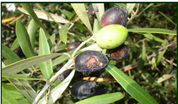
Sintomas de gafa em azeitonas

À aproximação de chuvas continuadas, recomenda-se a aplicação de um tratamento à base de cobre .