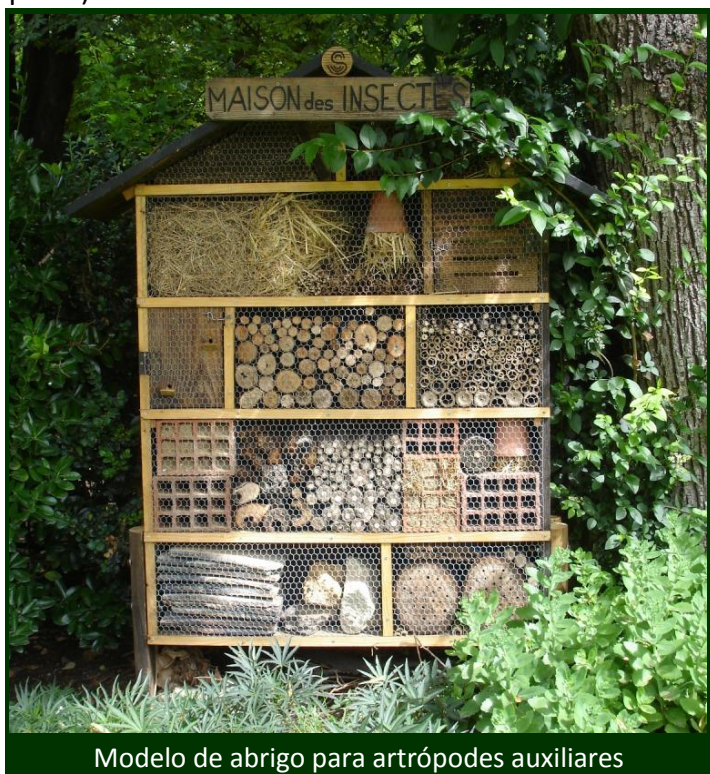
Modelo de abrigo para artrópodes auxiliares

Construa e instale abrigos para insetos e outros artrópodes úteis. São de fácil construção e podem ser realizados com materiais reaproveitados existentes na exploração agrícola (madeira, telhas, redes de galinheiro, tijolos de barro, cacos, lenha, palha).