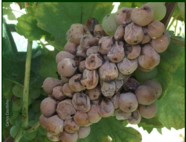
Podridão ácida (bagos castanhos, alguns deles já apodrecidos, com a polpa liquefeita e esvaziados)

A podridão ácida faz aumentar a acidez volátil dos mostos , contribuindo para a perda de qualidade dos vinhos . Pode des-