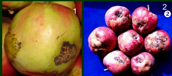
Manchas de pedrado 1 frutos desvalorizados 2 frutos destruídos