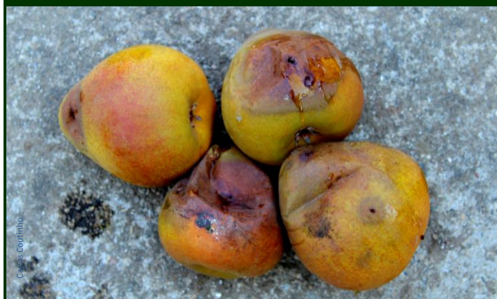
Peras destruídas pelas larvas de mosca do Mediterrâneo - aspeto exterior ↑ aspeto interior ↓