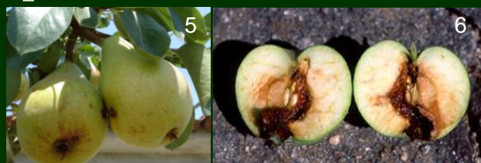
Bichado 5 e 6 frutos destruídos