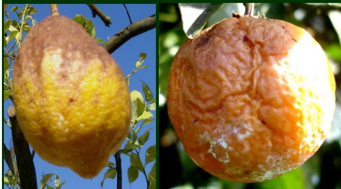
Sintomas de míldio em frutos