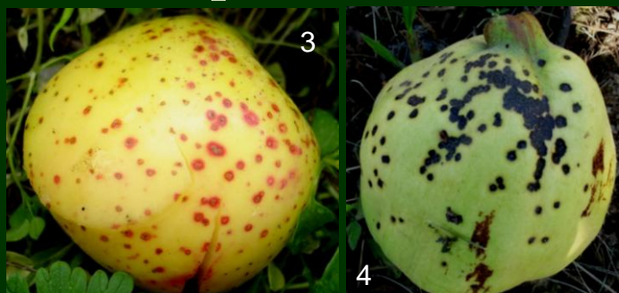
Pedrado lenticular em maçã 3 fruto destruído 4 Entomosporiose em marmelo (fruto desvalorizado)