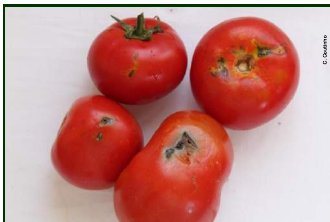
Estragos causados pelas larvas de Tuta

Para futuro, voltando a fazer a cultura, é necessário proceder à análise e correção do pH do solo, aplicando um corretivo à base de cálcio (calcário ou cal apagada).