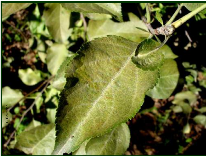
Sintomas de ataque de aranhaço na folha de macieira

Não estão homologados acaricidas para o Modo de Produção Biológico. No entanto, o uso de fungicidas à base de enxofre pode contribuir para a limitação das populações de aranhaço vermelho.