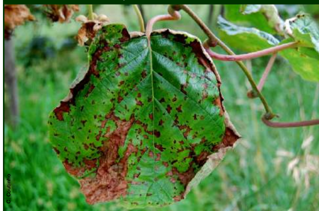
Sintomas na folha visíveis durante o verão