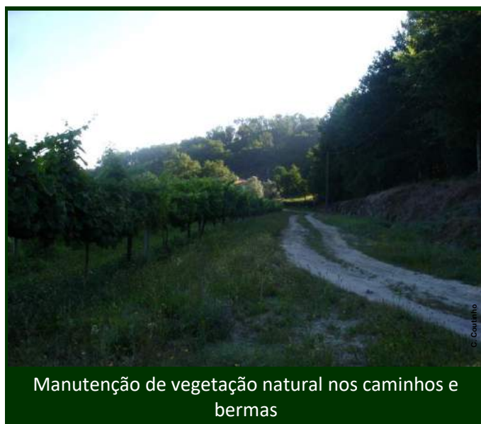
Manutenção de vegetação natural nos caminhos e bermas

A manutenção desta vegetação natural protege também o solo da erosão , ao reduzir o impacto da chuva e das águas correntes sobre o solo. A vegetação natural dos taludes, bermas e sebes é também uma barreira à entrada de fungos e de afídeos e outros insetos indesejáveis para o interior das culturas.