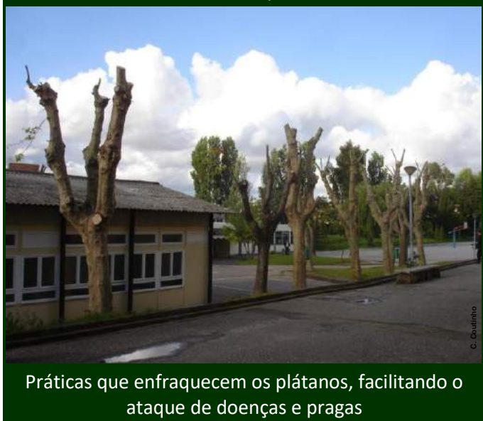
Práticas que enfraquecem os plátanos, facilitando o ataque de doenças e pragas