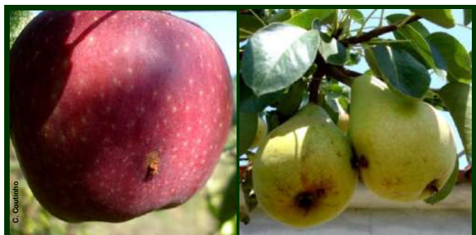
Orifício de saída de excremento das larvas do bichado em maçã e pera

Consulte a Ficha Técnica nº 37 (II Série/ DRAPN)