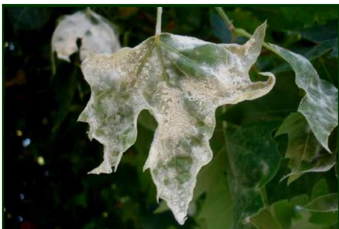
Sintomas do oídio do plátano na folha