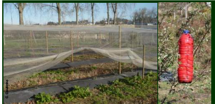
Depois da colheita, abra as redes de proteção para entrem os pássaros e mantenha as armadilhas em bom funcionamento

Recordamos que, tendo em conta os intervalos de segurança, em caso de necessidade, apenas deverão ser aplicados inseticidas em variedades de maturação tardia no nosso clima (Aurora, Columbus, Elliot, Ochlockonee, Powderblue, Skyblue, etc.).