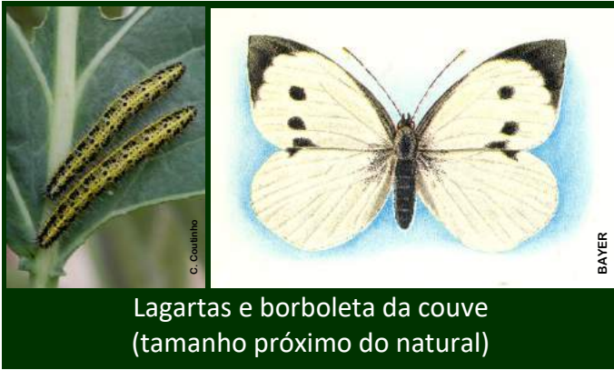
Lagartas e borboleta da couve (tamanho próximo do natural)

EXPERT, STEWARD, KARATE ZEON, KARATE +, JUDO, ATLAS, NINJA with ZEON technology, etc.. ).