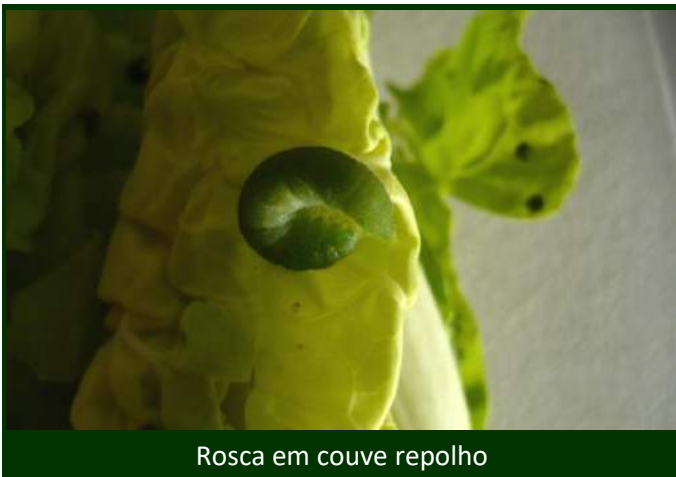
Rosca em couve repolho

No Modo de Produção Biológico estão autorizados inseticidas à base de azadiractina (ALIGN, FORTUNE ASA) e de Bacillus thuringiensis (PRESA, SEQURA, TUREX).