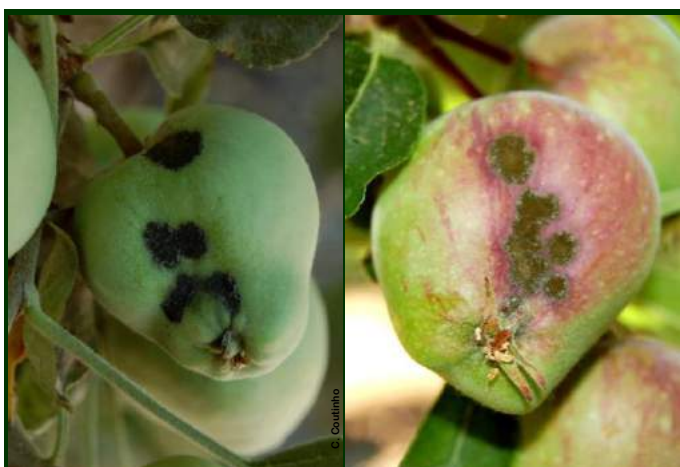
Sintomas de pedrado nos frutos em desenvolvimento

Para combate ao pedrado no Modo de Produção Biológico , são autorizados fungicidas à base de enxofre ou SERENADE MAX