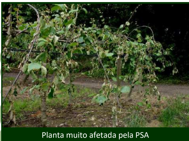
Planta muito afetada pela PSA