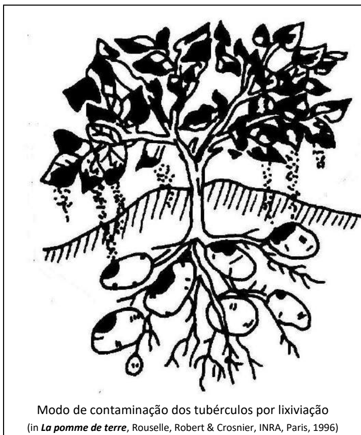
Modo de contaminação dos tubérculos por lixiviação (in La pomme de terre , Rouselle, Robert & Crosnier, INRA, Paris, 1996)

A infecção das batatas pelo míldio leva a perdas durante o armazenamento, ao encarecimento da triagem e à desvalorização do produto.