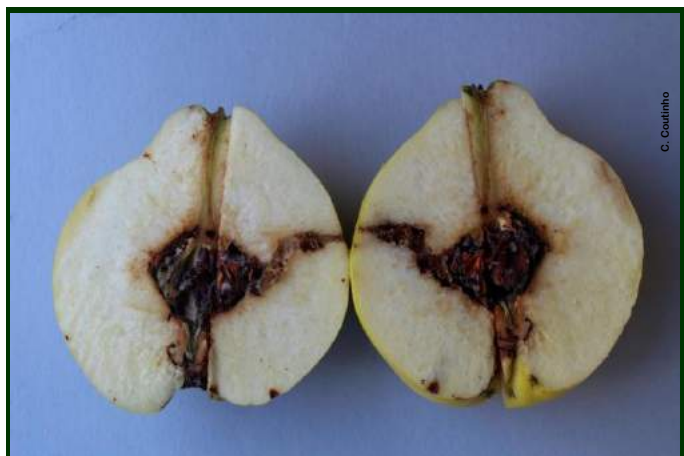
Estragos da larva de Cydia molesta em marmelo

Vigie os marmeleiros. Verifique se existem marmelos com perfurações de bichado. Aguarde novas informações.