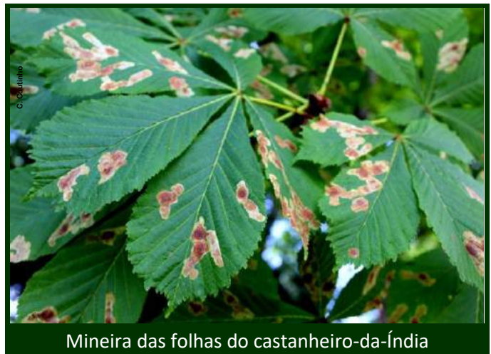
Mineira das folhas do castanheiro-da-Índia

Não cortar as folhas , pois neste momento a palmeira produz grande quantidade de compostos que atraem os adultos do escaravelho, que o corte de folhas liberta para a atmosfera.