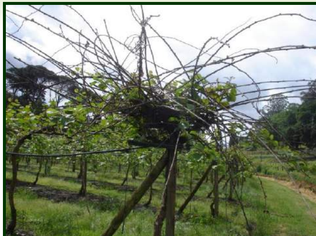
Planta invadida pela PSA, com os ramos secos

Aconselha-se a aplicação de um fungicida à base de cobre , que contenha hidróxido de cobre ( AIRONE SC ; BADGE WG ), de modo a impedir a reprodução e dispersão da bactéria durante os períodos de chuva.