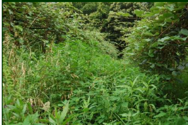
Erva muito alta nos pomares contribui para a manutenção do ambiente húmido favorável à PSA