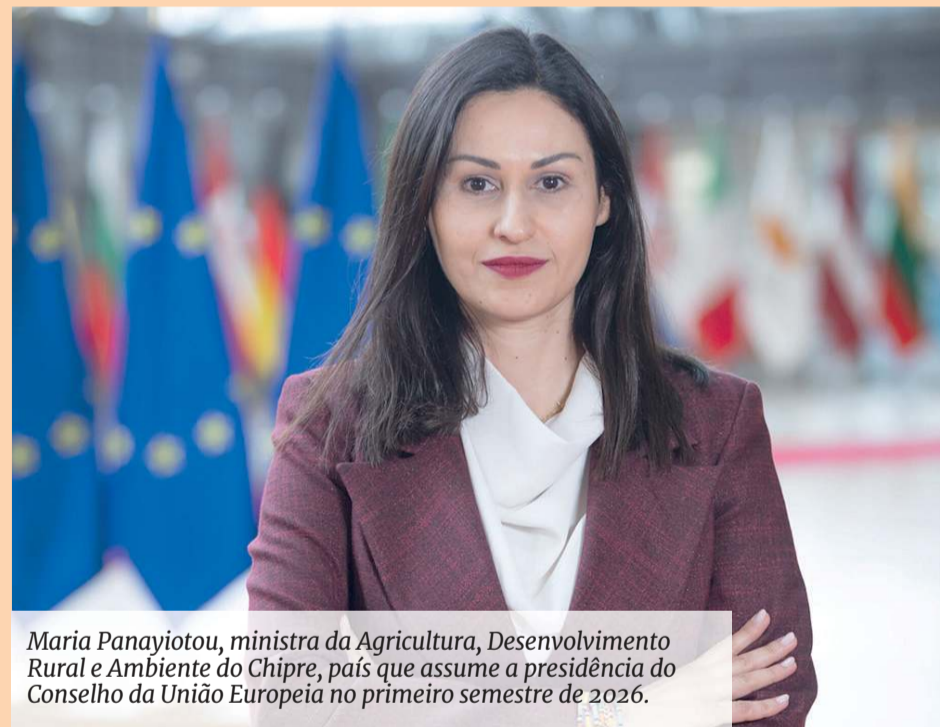
Maria Panayiotou, ministra da Agricultura, Desenvolvimento Rural e Ambiente do Chipre, país que assume a presidência do Conselho da União Europeia no primeiro semestre de 2026.

A decisão acontece em plena presidência cipriota do Conselho da União Europeia (UE), que termina a 30 de junho. Chipre está, aliás, a impulsionar este modo de produção agrícola no seu território e quer atingir 11 mil hectares das terras agrícolas em modo biológico (9%) até 2027. Maria Panayiotou, ministra da Agricultura, Desenvolvimento Rural e Ambiente do Chipre, não tem dúvidas: “A agricultura biológica é um ativo estratégico para os sistemas alimentares, a biodiversidade e as zonas rurais da Europa”.