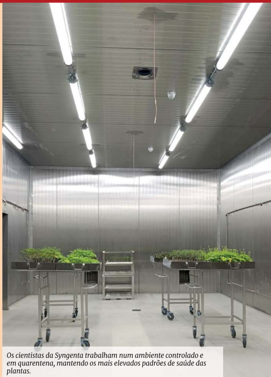
Os cientistas da Syngenta trabalham num ambiente controlado e em quarentena, mantendo os mais elevados padrões de saúde das plantas.