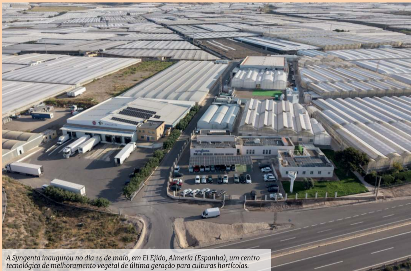
A Syngenta inaugurou no dia 14 de maio, em El Ejido, Almería (Espanha), um centro tecnológico de melhoramento vegetal de última geração para culturas hortícolas.

O diretor global de investigação e desenvolvimento de sementes hortícolas da Syngenta tem a noção de que o caderno de encargos da empresa está traçado: