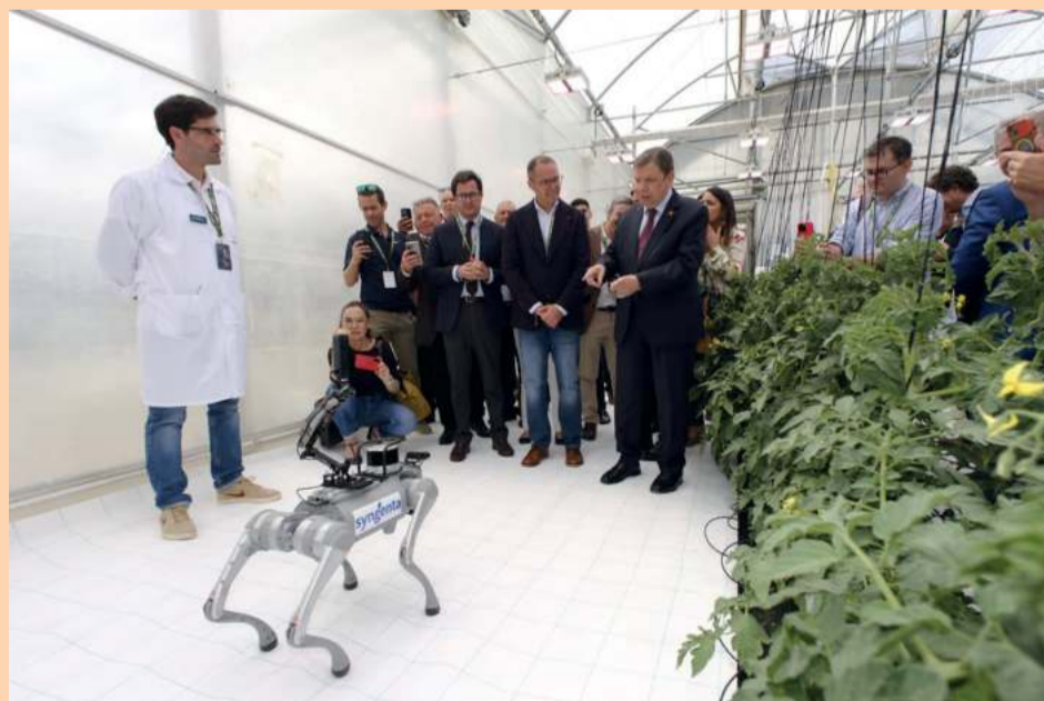
O controlo do crescimento e do desenvolvimento das novas variedades vegetais no centro tecnológico da Syngenta é feito com recurso a robots. O ministro da Agricultura, Pesca e Alimentação de Espanha, Luis Planas (à direita, na imagem), acompanhou as explicações.

* A jornalista viajou para Almería a convite da Syngenta.