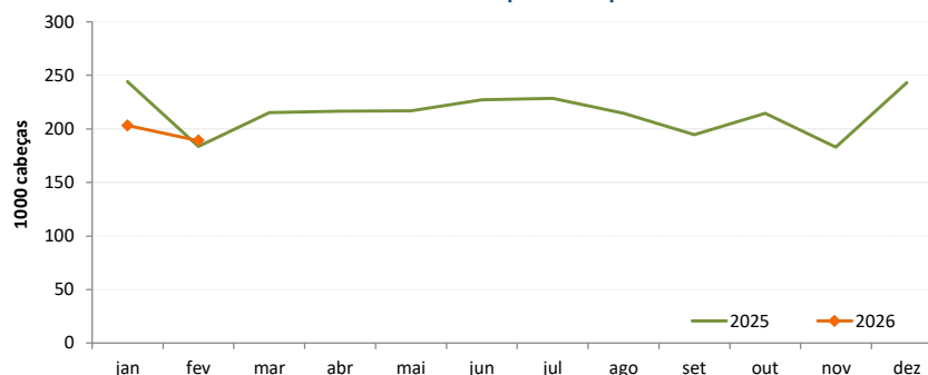
Coelhos - Abates aprovados para consumo