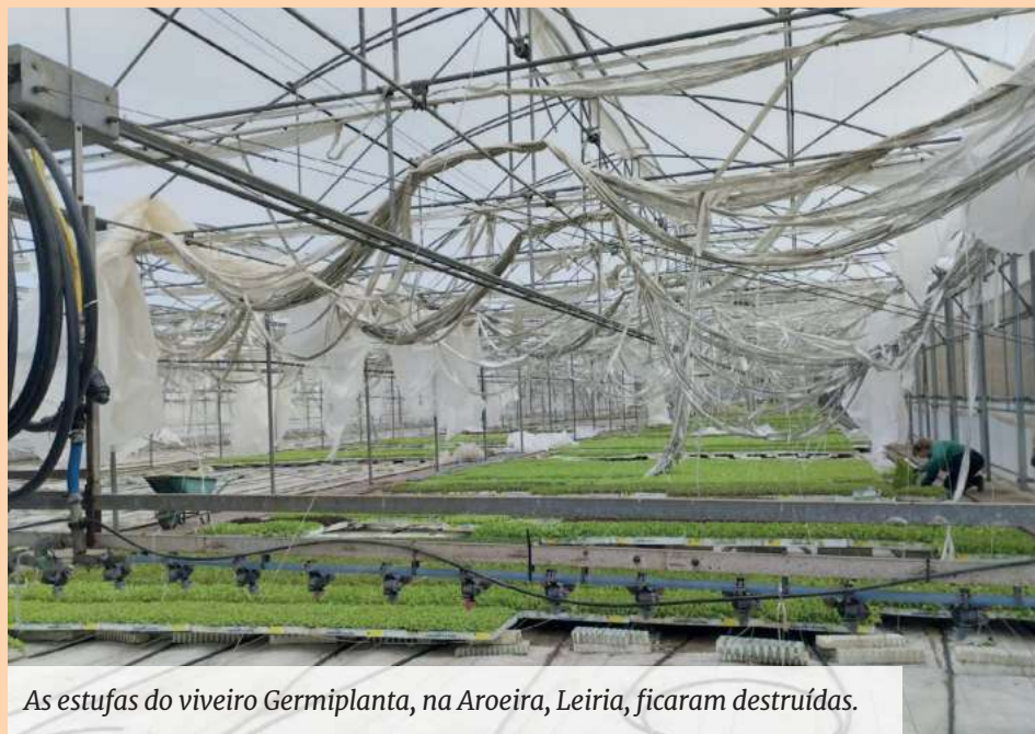
As estufas do viveiro Germiplanta, na Aroeira, Leiria, ficaram destruídas.

Mais de uma semana depois da passagem da tempestade Kristin por Portugal e, em especial, pela região Centro, os prejuízos ainda são difíceis de medir. Na agricultura, agropecuária e nas florestas, os proprietários fazem contas à vida. Há estufas e viveiros de plantas destruídos, vacarias cujas coberturas foram pelos ares e múltiplas explorações de suínos alagadas e, nalguns casos, isoladas. A Federação Portuguesa de Associações de Suinicultores (FPAS) já reuniu com o ministro da Agricultura. Os prejuízos são superiores a “220 milhões de euros”.