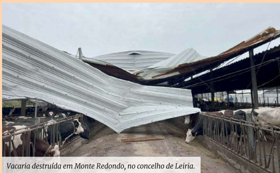
Vacaria destruída em Monte Redondo, no concelho de Leiria.