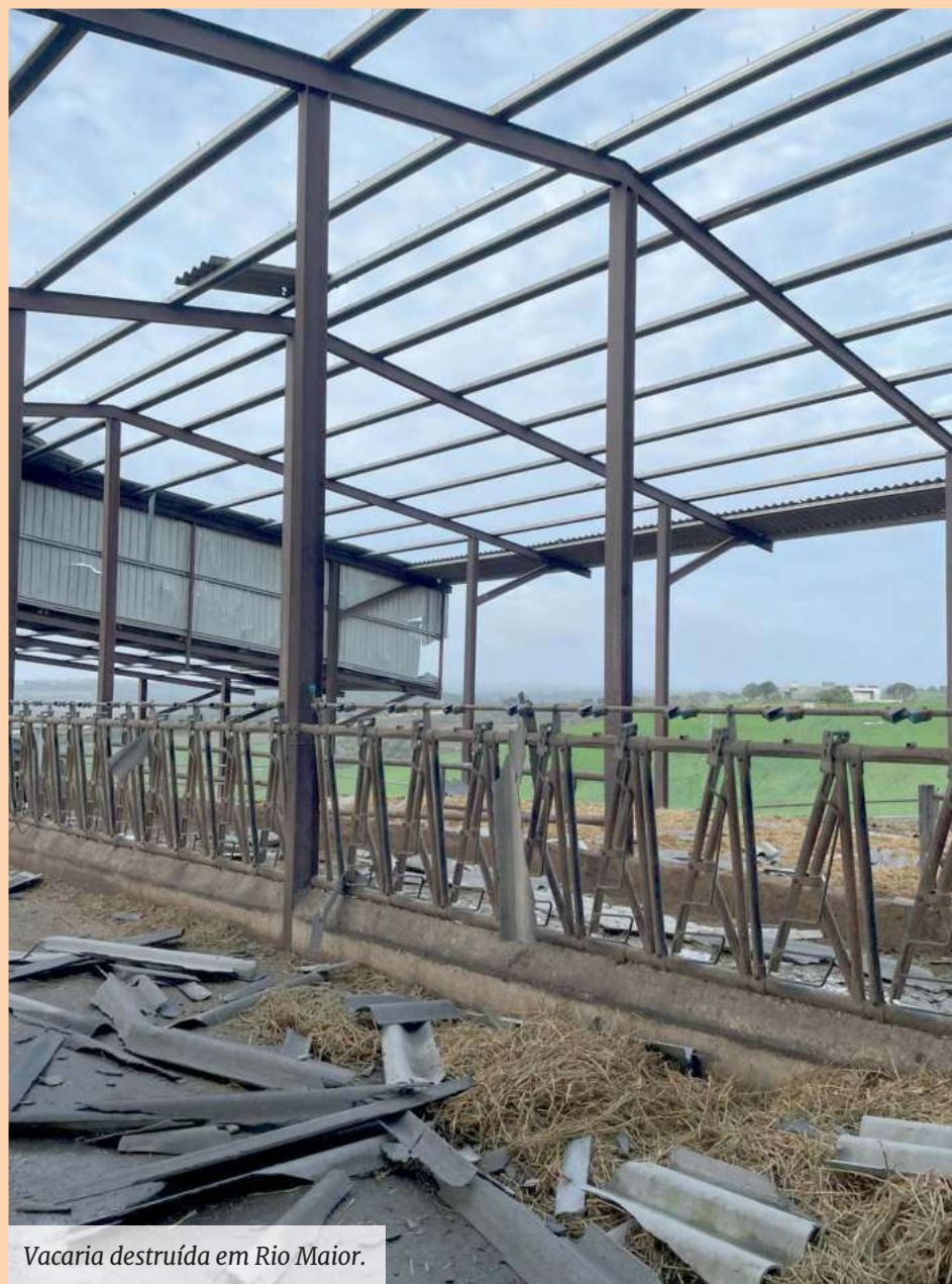
Vacaria destruída em Rio Maior.

A primeira estimativa de prejuízos é “na ordem dos 220 milhões de euros”, avança o secretário-geral da FPAS, frisando que é um montante provisório, pois “ainda há muita gente na zona de Leiria por contactar”.