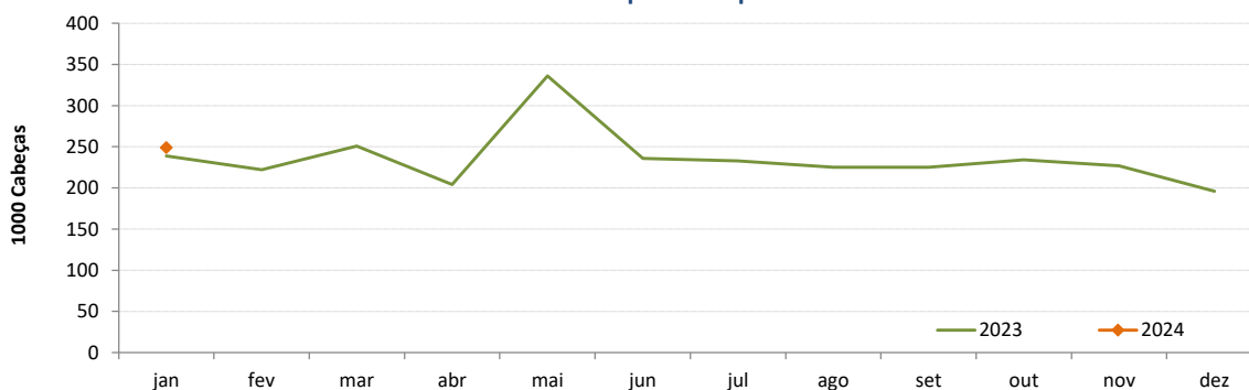
Coelhos - Abates aprovados para consumo