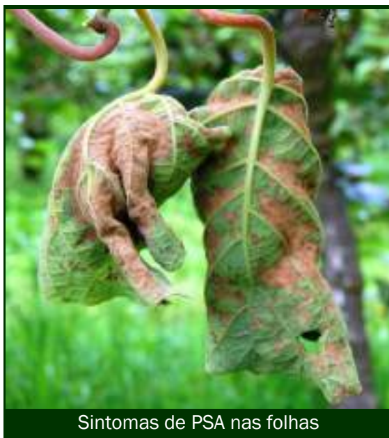
Sintomas de PSA nas folhas

⑨ Depois da descarga, todas as embalagens utilizadas devem ser limpas de terra, folhas e outros restos vegetais e lavadas com água sob pressão, antes de voltarem aos pomares. ( Os restos vegetais – ramos e folhas – são os principais meios de disseminação da PSA ).