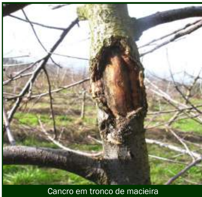
Cancro em tronco de macieira

Mais tarde, durante a poda, corte, retire do pomar e queime os ramos com feridas de cancro. As lenhas de poda com sintomas de cancro não devem ser aproveitadas para destroçar e incorporar no solo diretamente. Devem ser destroçadas e compostadas, antes da incorporação.