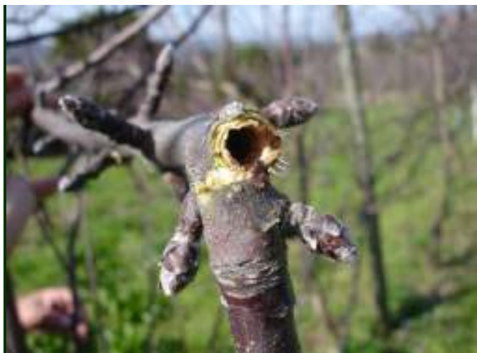
Tronco de jovem macieira mostrando a galeria aberta pela larva de zêuzera, que levou à sua quebra e perda da árvore.