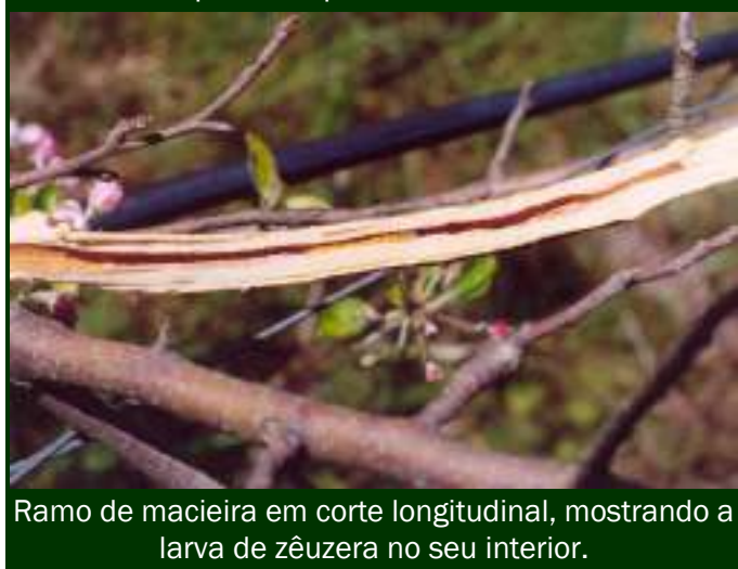
Ramo de macieira em corte longitudinal, mostrando a larva de zêuzera no seu interior.