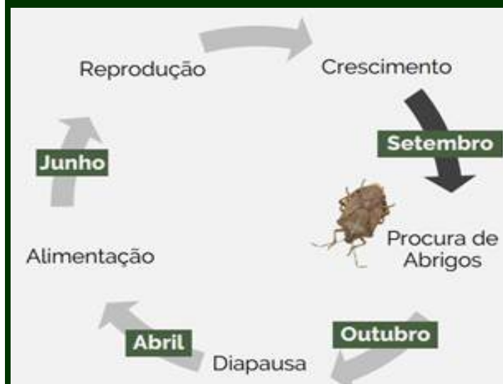
Comportamento da praga ao longo do ano