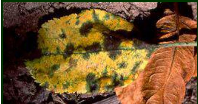
Folhas de macieira com sintomas de pedrado, caídas no solo, no outono

Outra técnica é destroçar as folhas caídas no solo, passando um destroçador de martelos. O destroçamento fino das folhas caídas pode reduzir em 80% o inóculo do pedrado na próxima primavera, facilitando o controlo da doença.