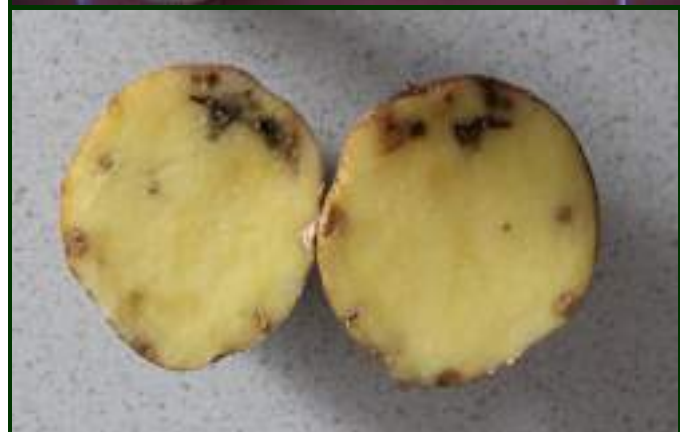
Sintomas de ataque de traça da batata