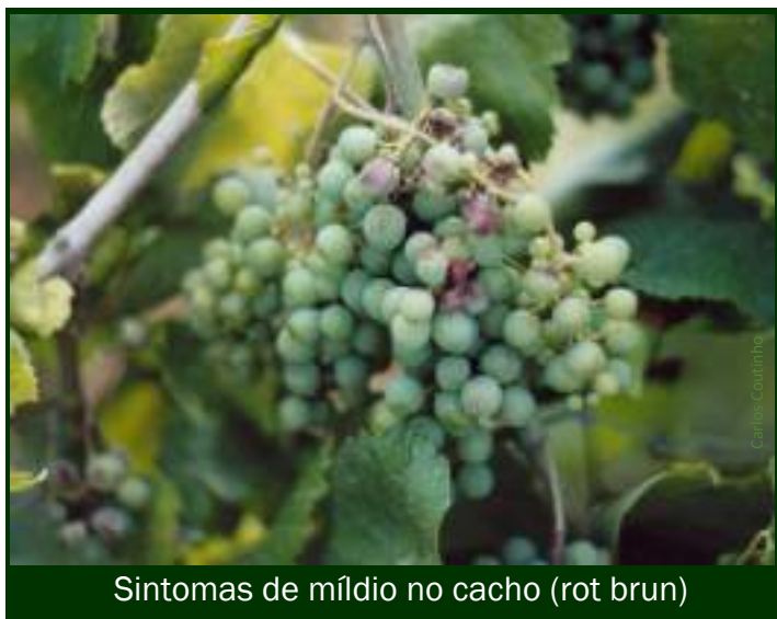
Sintomas de míldio no cacho (rot brun)

cachos no período entre o fecho do cacho e o início do pintor (rot brun).