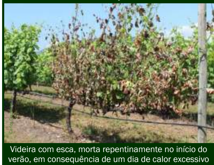
Videira com esca, morta repentinamente no início do verão, em consequência de um dia de calor excessivo