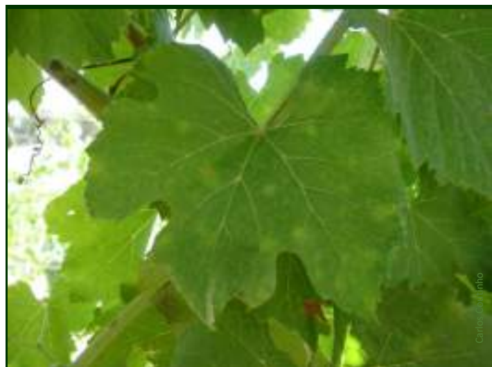
Sintomas de óidio na folha