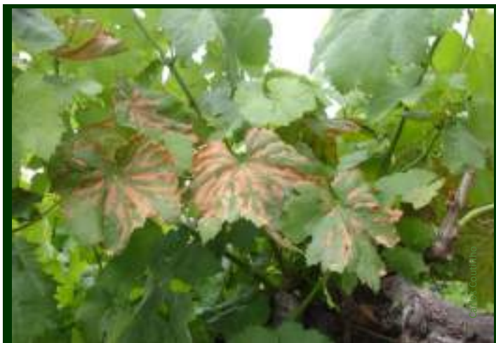
Primeiras manifestações dos sintomas da esca, no início do verão

Os sintomas da esca já são bem visíveis nesta época do ano.