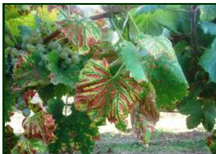
Aspeto dos sintomas da esca, já entrado o verão, no início da maturação as uvas

Recentes períodos de chuva seguidos de dias de muito calor, apressam o fim de algumas videiras mais enfraquecidas pela doença, que secam repentinamente ( apoplexia ).