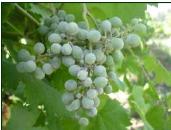
Sintomas de óidio no cacho ↑ na vara ↓ e na folha →, como podem ser vistos nesta fase de desenvolvimento da Vinha

Para o combate ao óidio da videira no Modo de Produção Biológico , estão autorizados fungicidas à base enxofre (não deve ser aplicado com temperaturas superiores a 32°C).