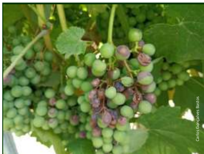
Sintomas de black rot no cacho

Os cachos estão ainda recetivos até ao pintor (e poderão ainda ser atacados depois do pintor).